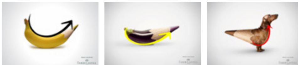
Figura 3 Uso da curva na campanha

Todas as formas básicas possuem três direções visuais básicas e são essas direções que dão sentido à elas. Observa-se nos cartazes também a curva, que é uma das direções do círculo. Para Dondis (1991) a curva tem grande importância para o significado da peça. Nos cartazes abaixo percebemos o uso da curva, trazendo estabilidade nas peças.